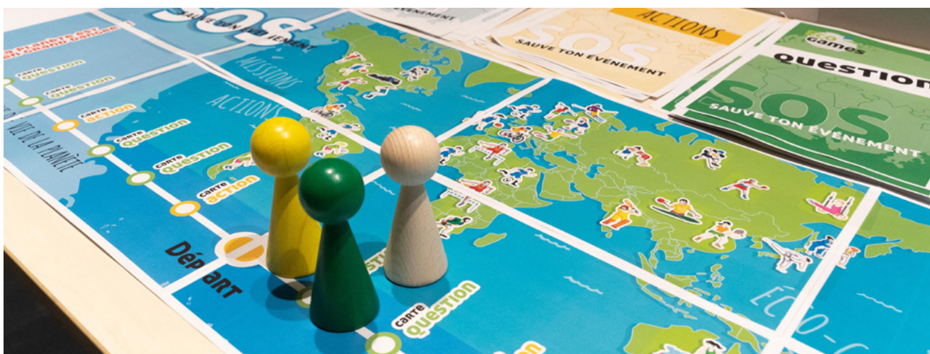
Mallette pédagogique « Eco-Games » réalisée en 2021

Les malettes ont été pensées pour être facilement transportables et peuvent faire l'objet, si besoin, d'une brève formation de la part d'un médiateur culturel du musée.